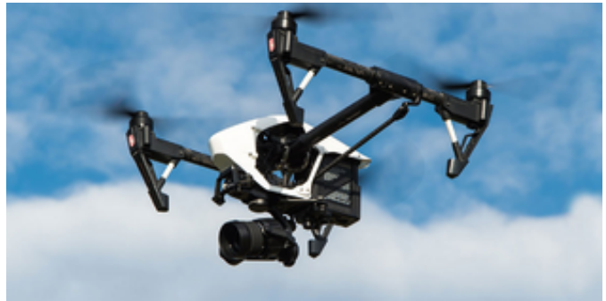
ドローン操縦講座