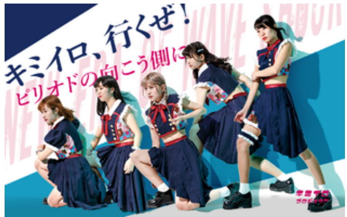
キミイロプロジェクト